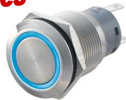
SVBP LED B19